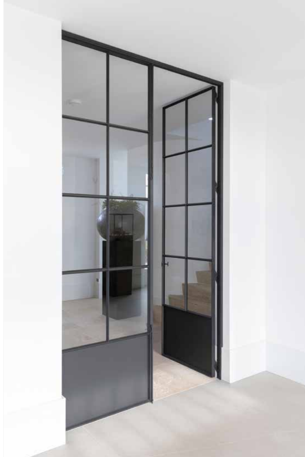
De deuren zijn geleverd door Villadomus.

“WE DOEN NOG ÉÉN KEER GEK, WANT WE ZIJN INTUSSEN AL ZES KEER VERHUISD”