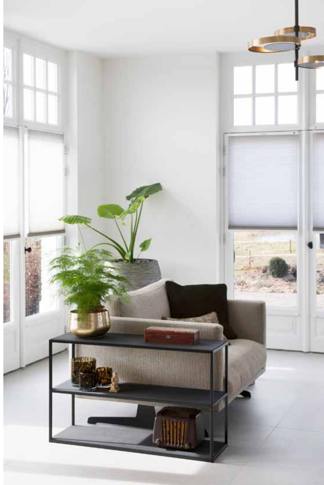
De vele kamerplanten vullen de ruimte en kleden het interieur af. Op de vloer liggen grote tegels van Allure Grey van Livingceramics.

“ALS HET WATER HOOG STAAT, IS ONS HUIS OMRINGD DOOR WATER EN KUNNEN WE ALLEEN MET EEN BOOTJE VAN ONS EILANDJE AF”