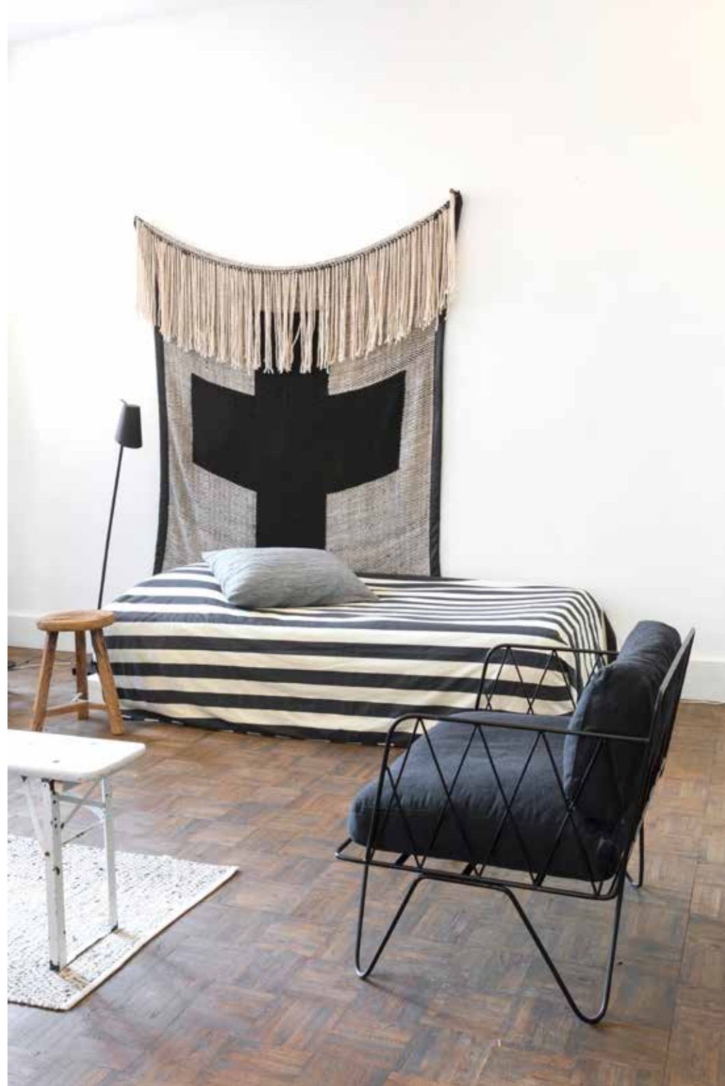
Plafondlampen van Ay Illuminate, de staande lamp is van It's About Romi. Alle meubels en vloerkleden verkrijgbaar via Loft.

"WE WAREN HET METEEN EENS DAT WE DEZE ONGESLEPEN DIAMANT NIET AAN ONS VOORBIJ KONDEN LATEN GAAN"