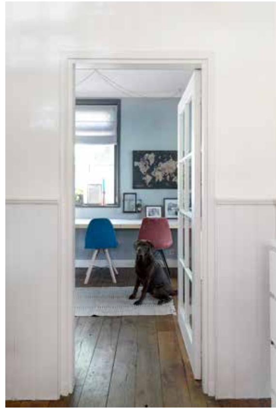
'Trends zijn leuk, maar niet voor lang. Ik hou meer van een eigen stijl'